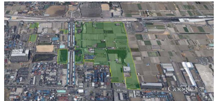
図：施行前の状況（Google earthより）

イトーヨーカ堂の大規模複合型 商業施設「Ario (アリオ)」 平成30年11月オープン予定